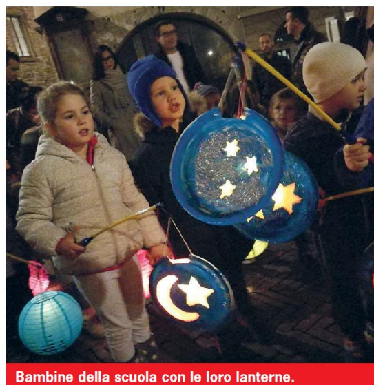
Bambine della scuola con le loro lanterne.

Fabrizio Pezzoli