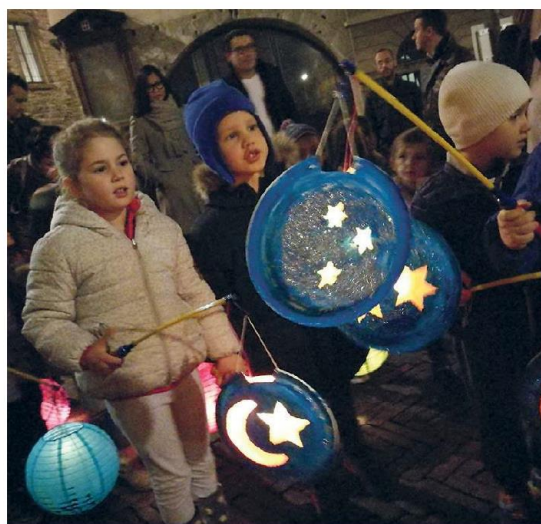
Bambine della scuola con le loro lanterne.

Fabrizio Pezzoli