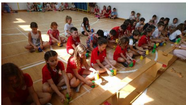
Il team della primaria

Fervono i preparativi per i festeggiamenti. I bambini si impegnano molto nelle prove e negli esercizi.